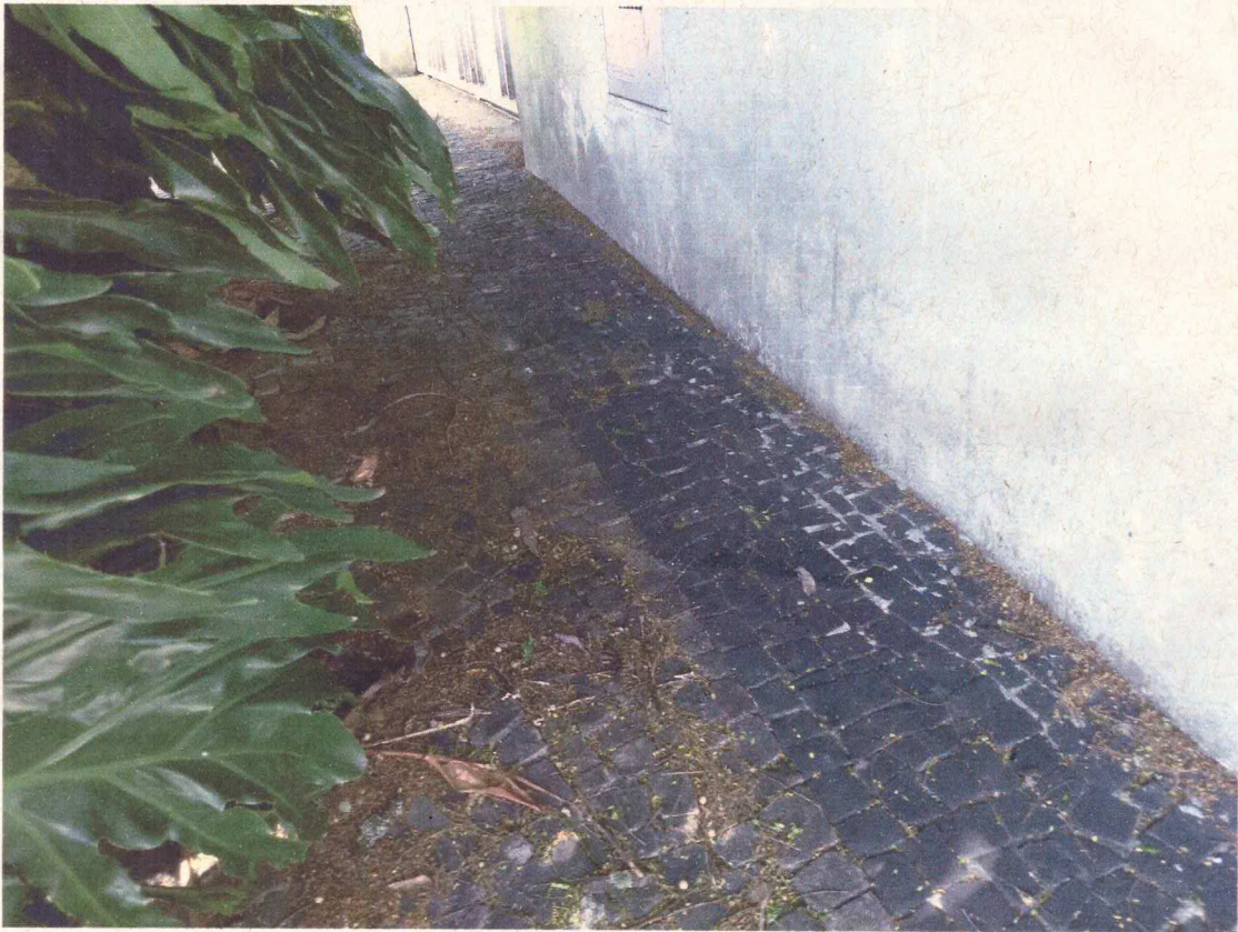
Muro sem rachaduras ou trincas