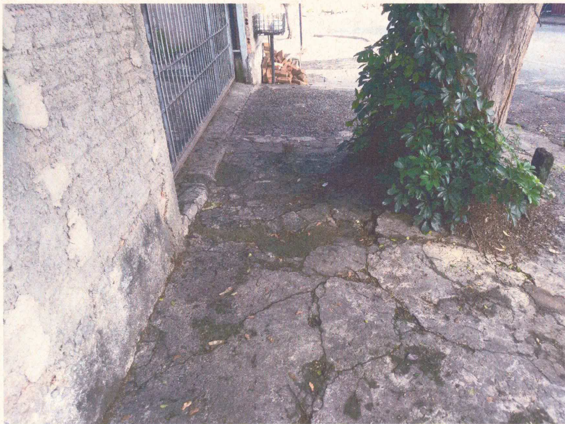
Calçada ligeiramente danificada, mas com acessibilidade