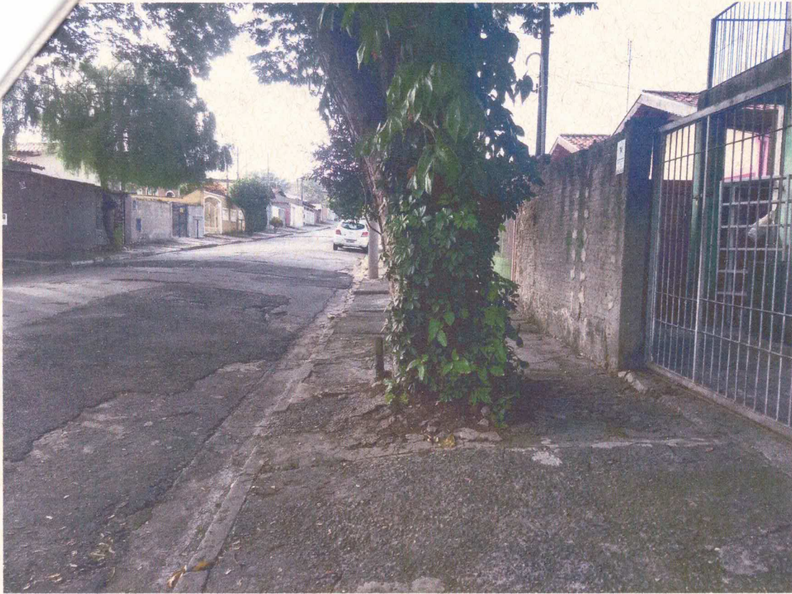
Tronco íntegro, sem pragas ou fungos