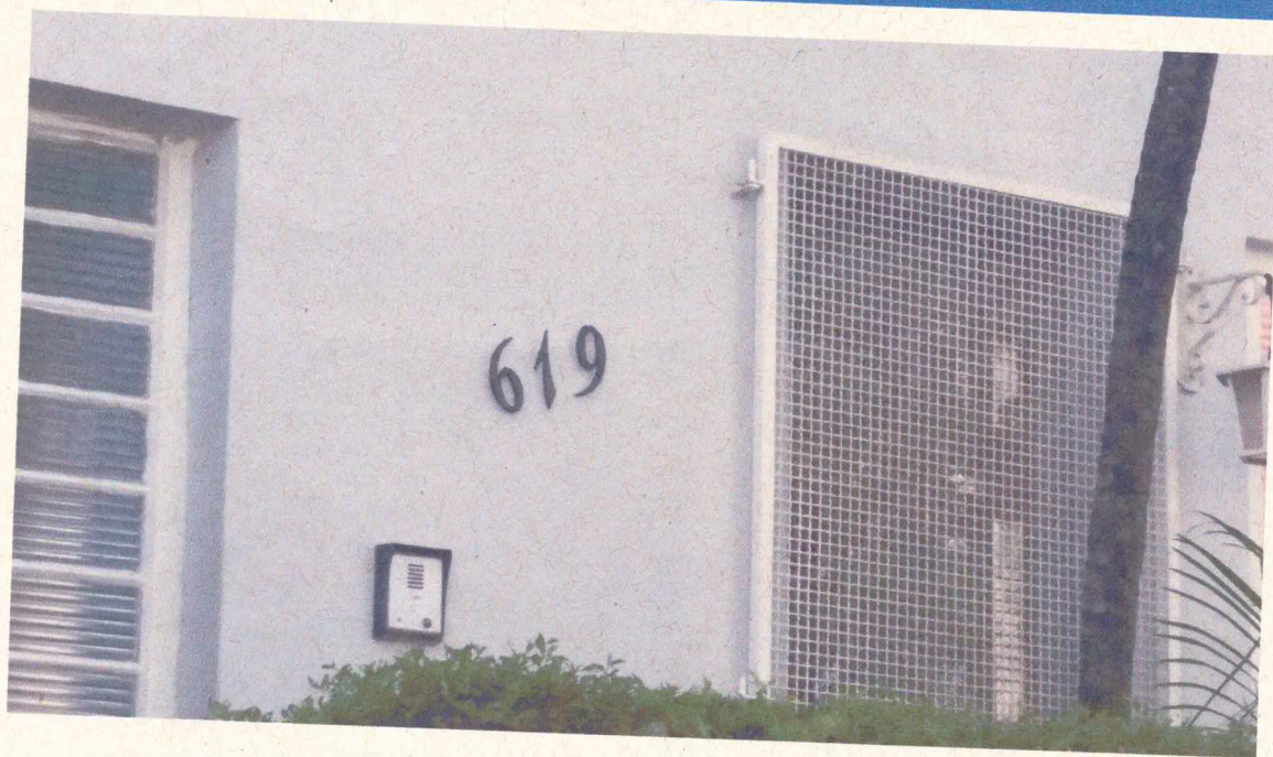
Ao lado do numeral na esquina.