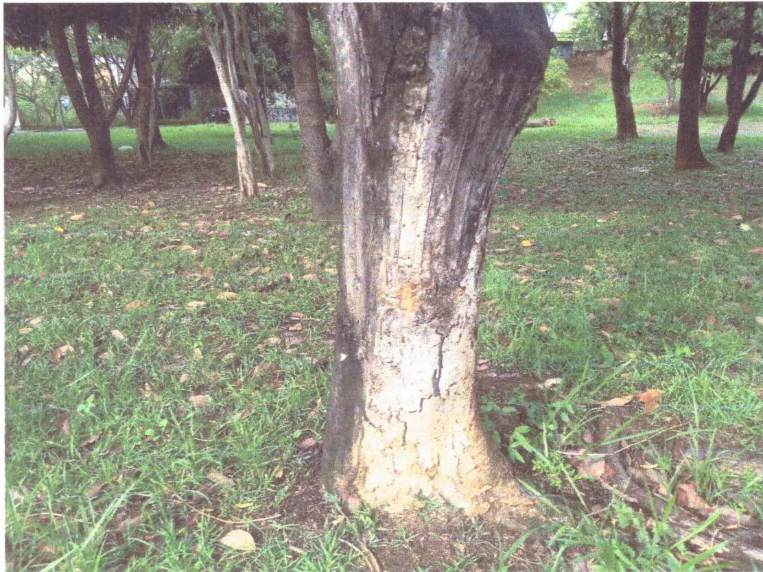
Tronco com infestação e cupins