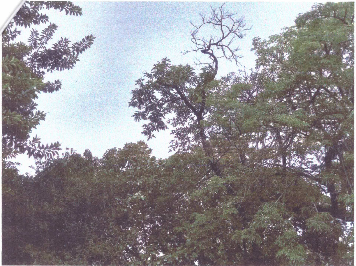
Copa com muitos ramos terminais secos