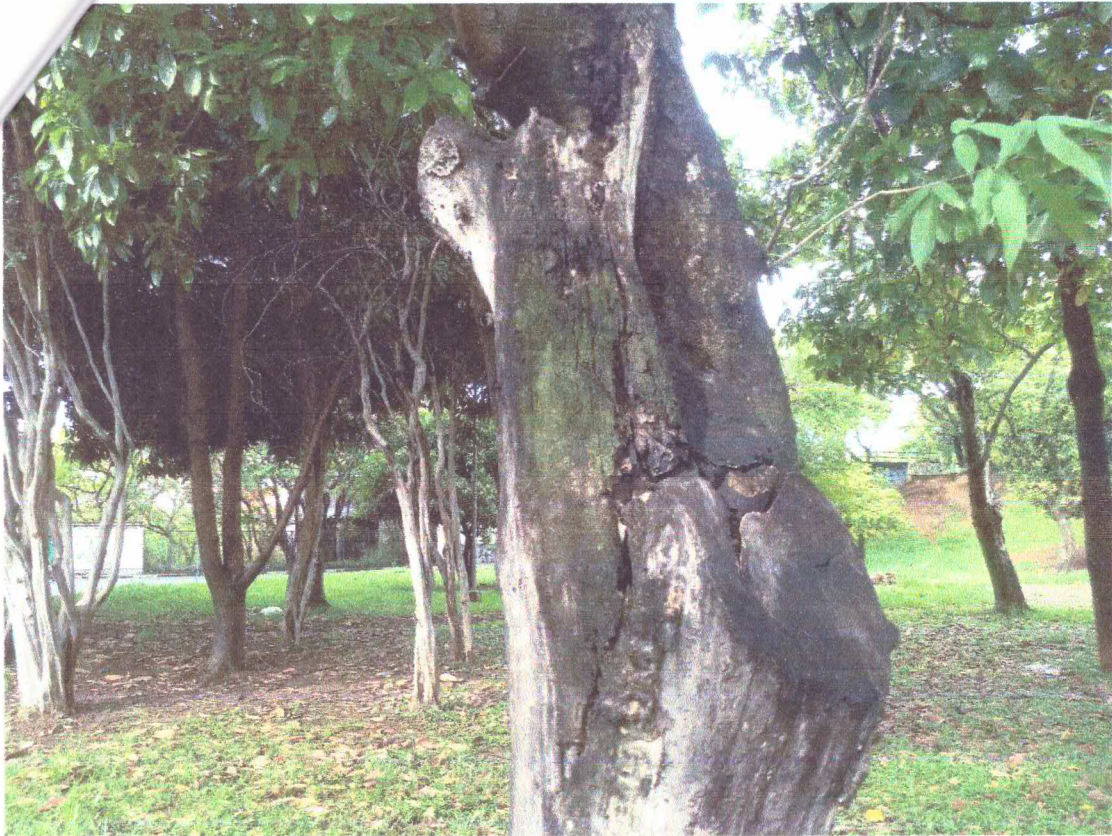
Tronco com podridão e com rachaduras mecânicas