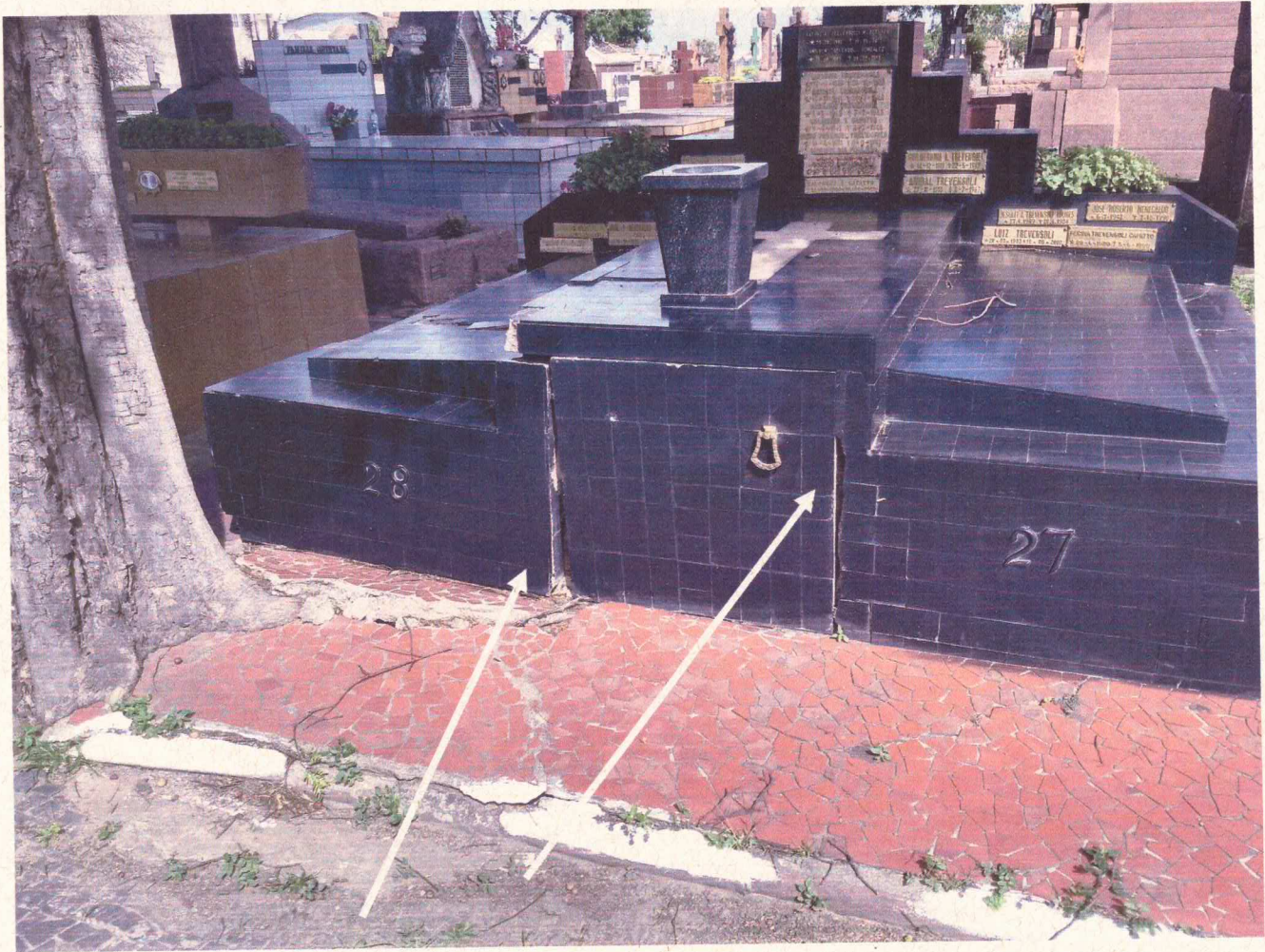
Frente dos túmulos está toda danificada