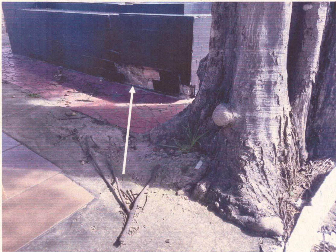
Raízes estão causando danos no túmulo 27 e 28