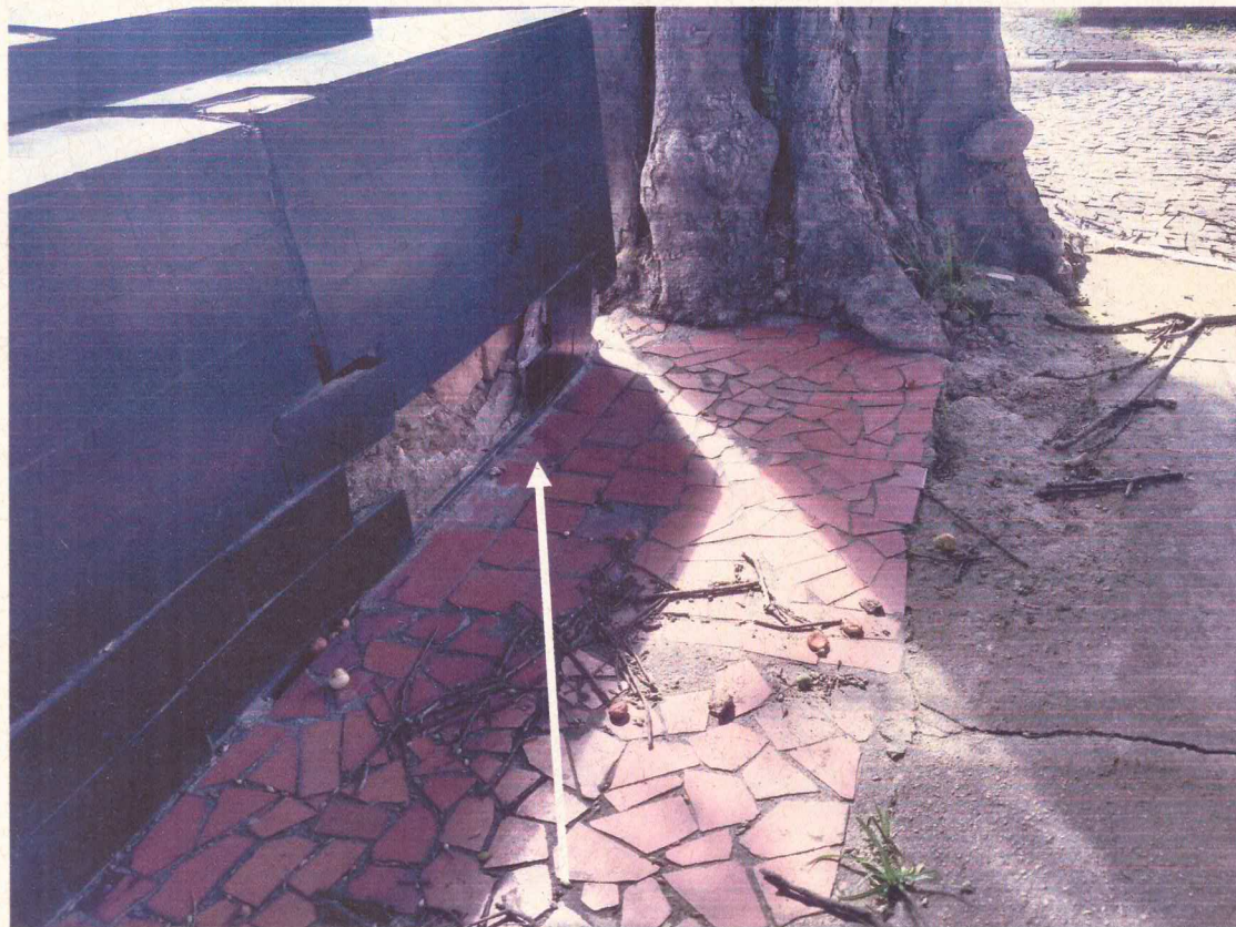
Raízes estão causando danos no túmulo 27 e 28