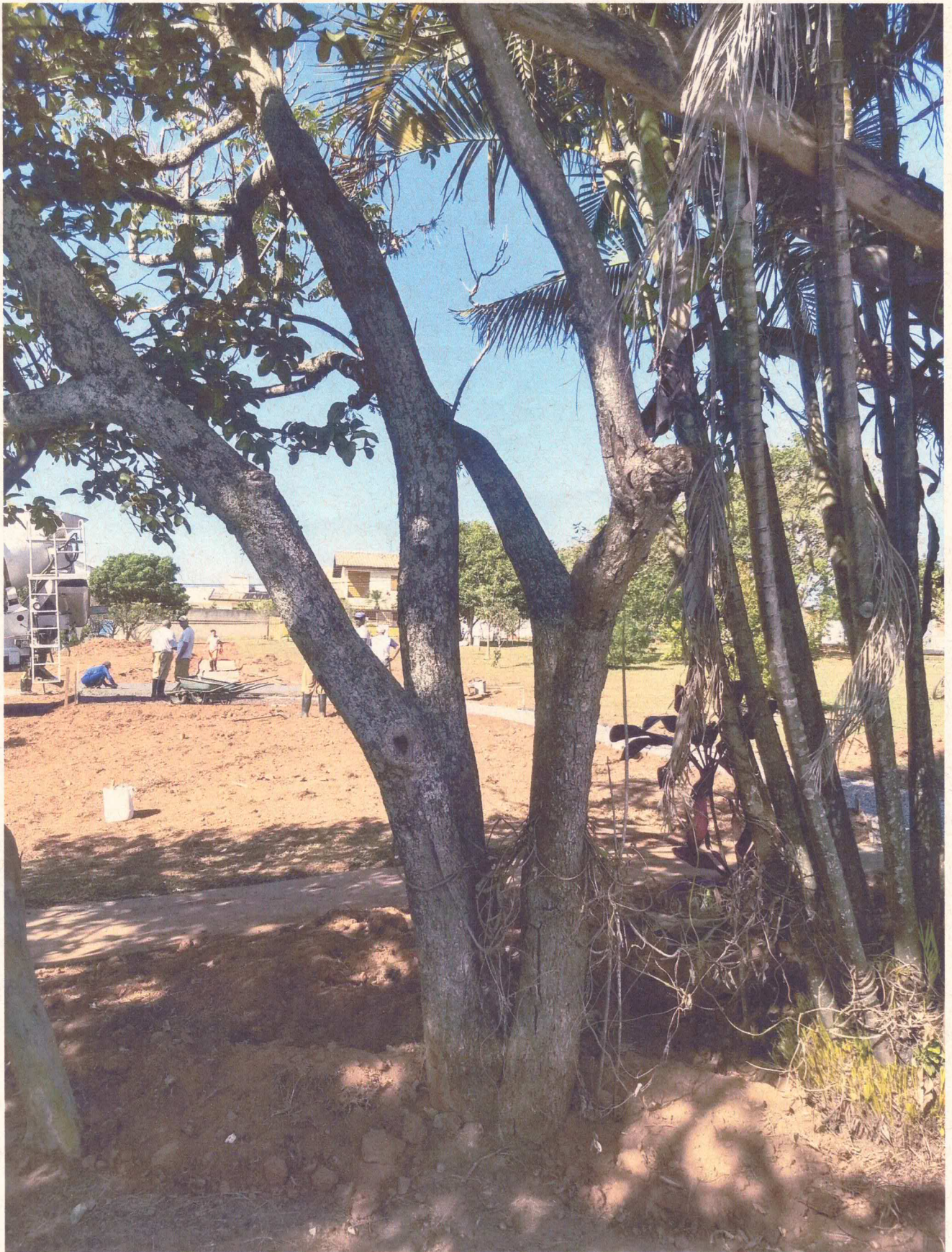
Árvore seca 02