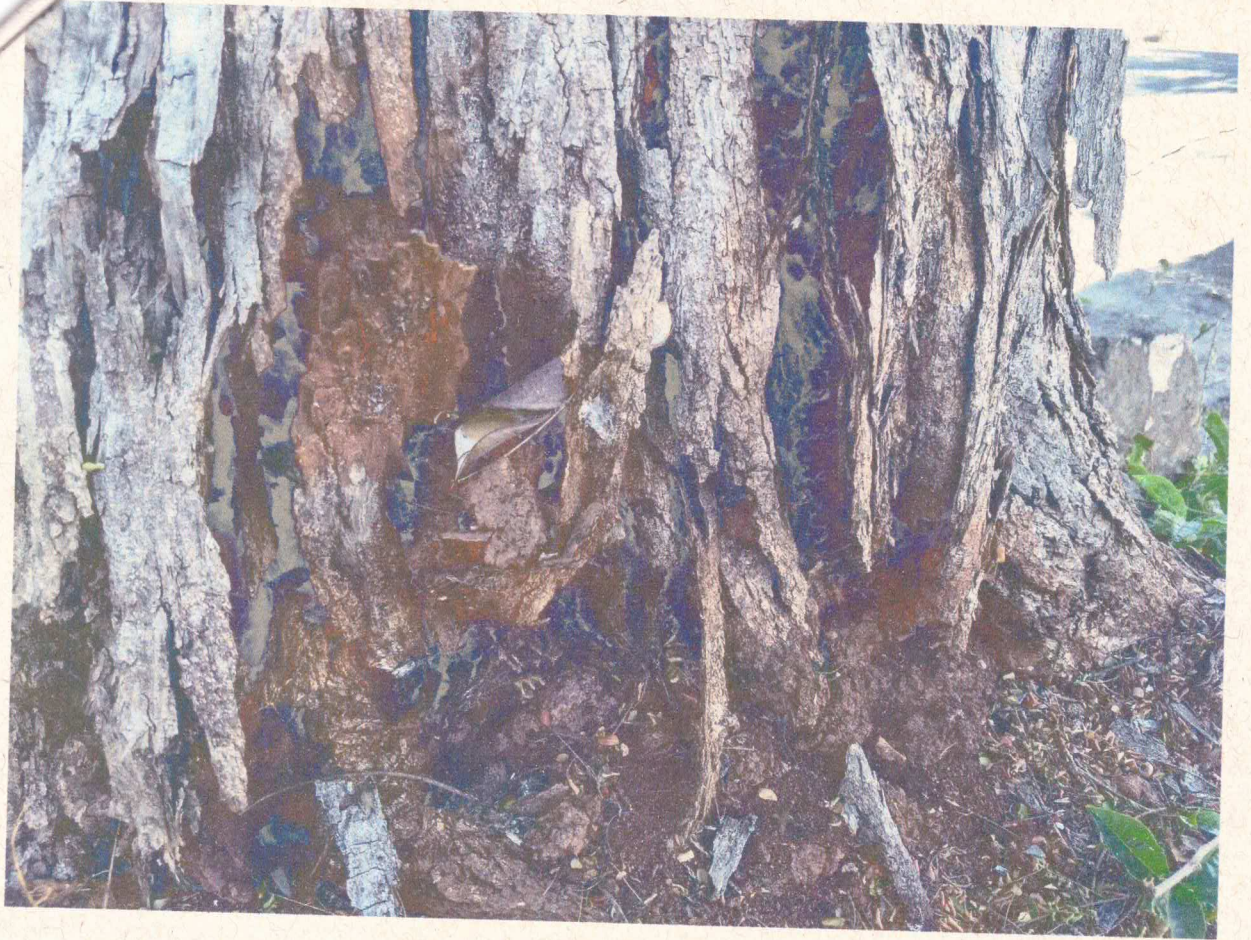
Presença de cupins na base do tronco