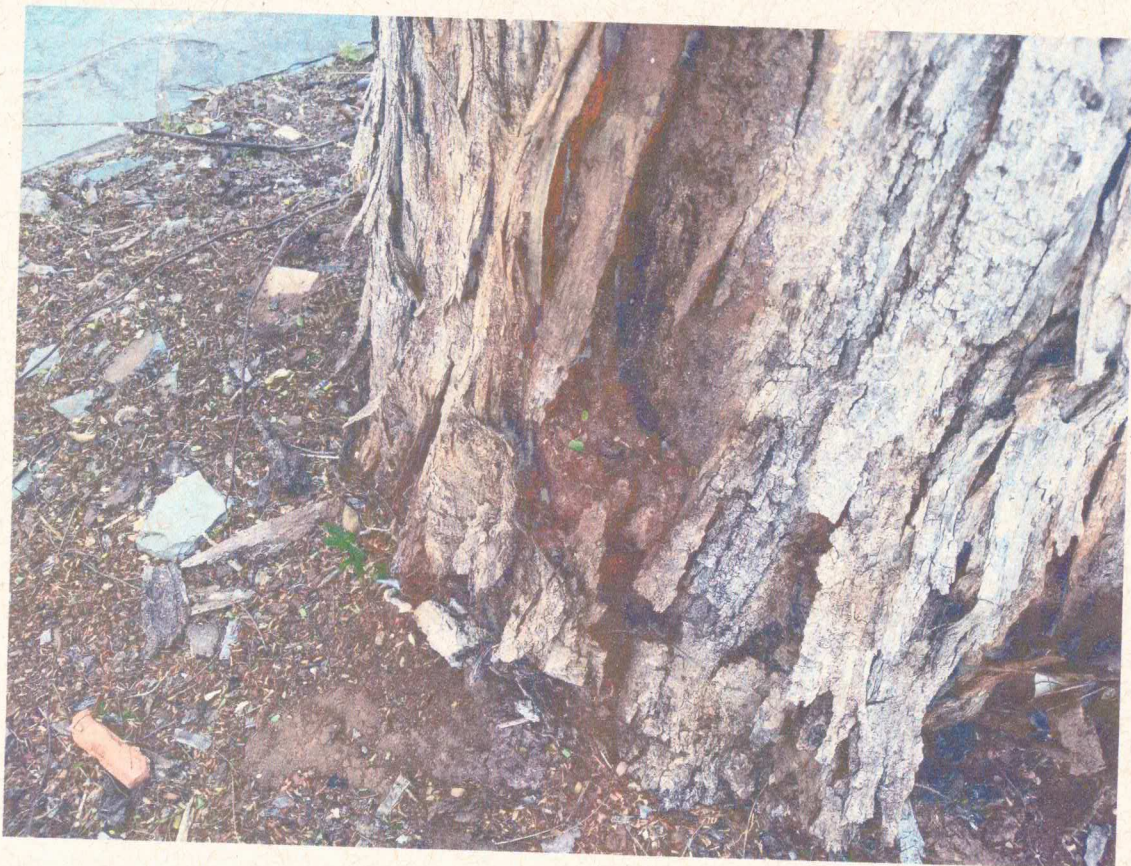
Presença de cupins na base do tronco