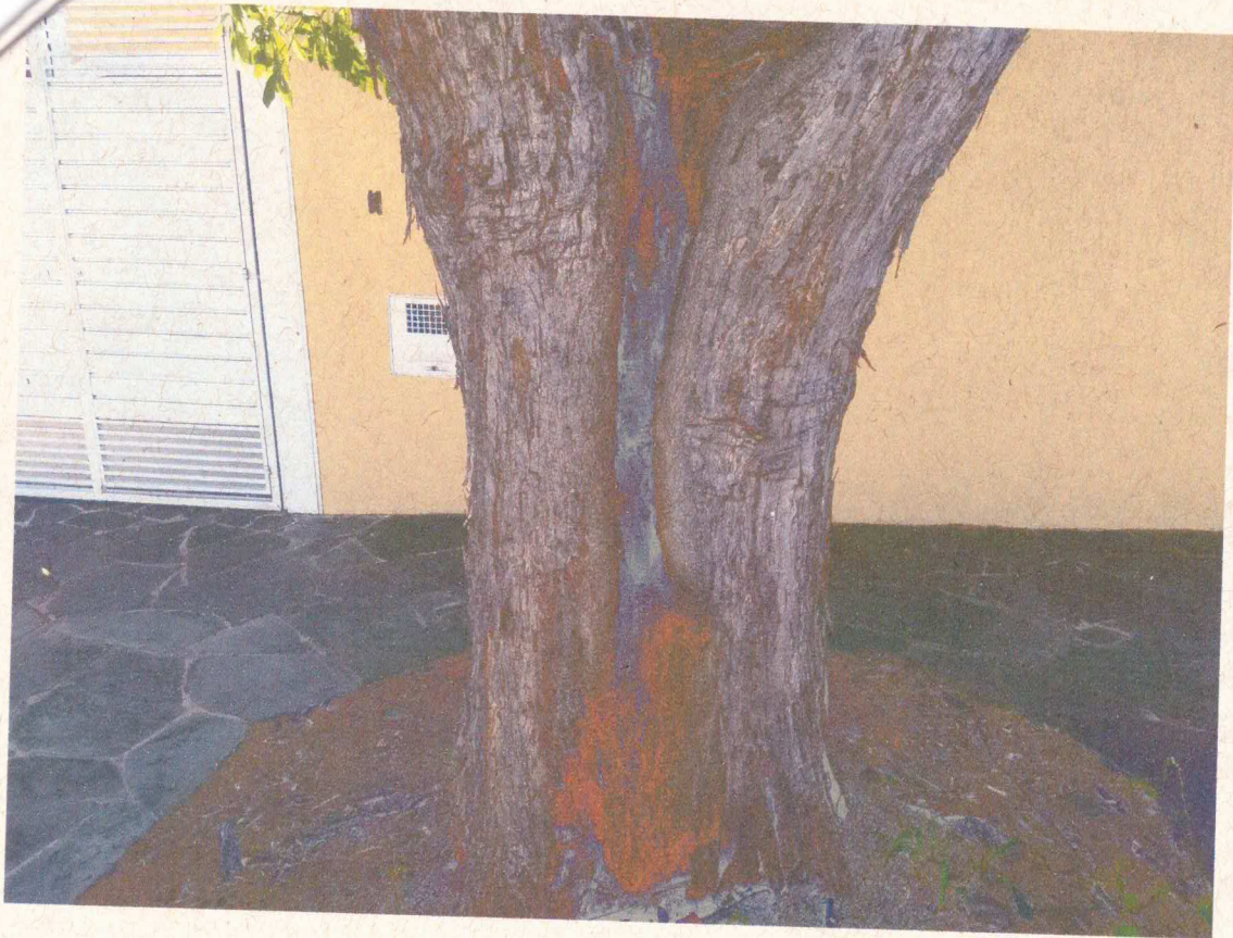
Biodeteriorização do tronco,