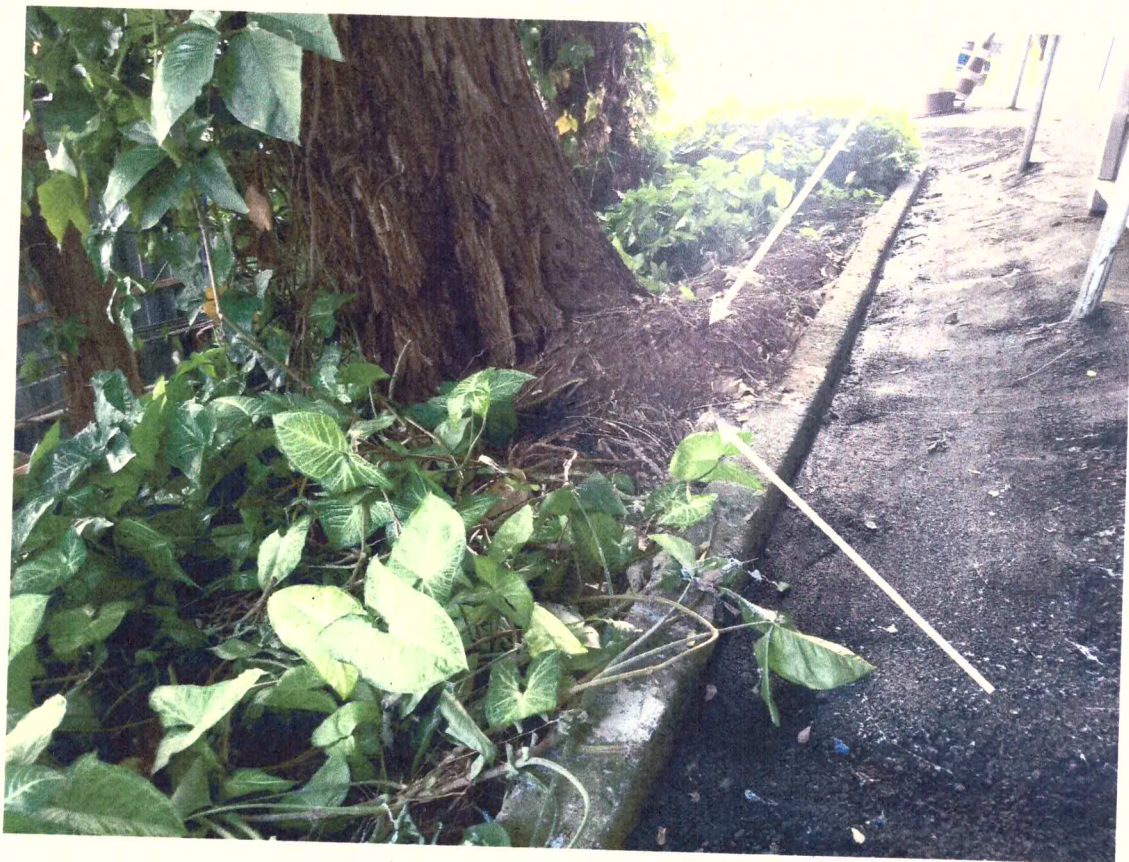
Terreno perto do tronco está levantando