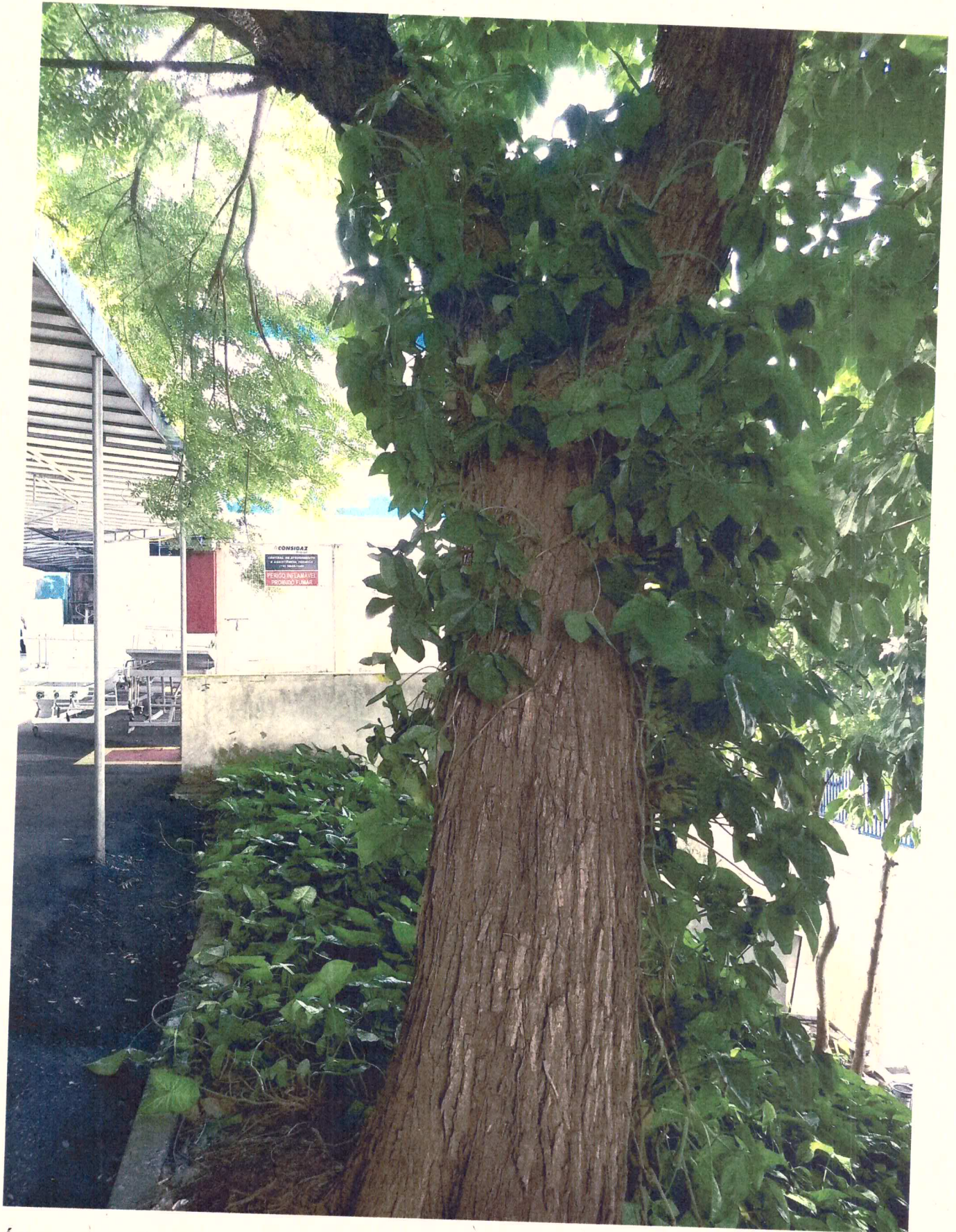
Árvore com inclinação perigosa e localizada em talude