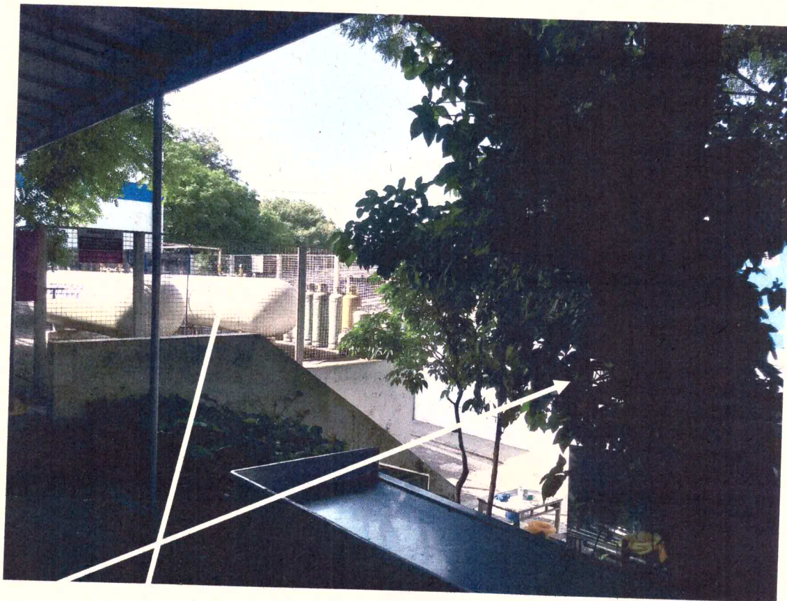
Árvore e central do GLP