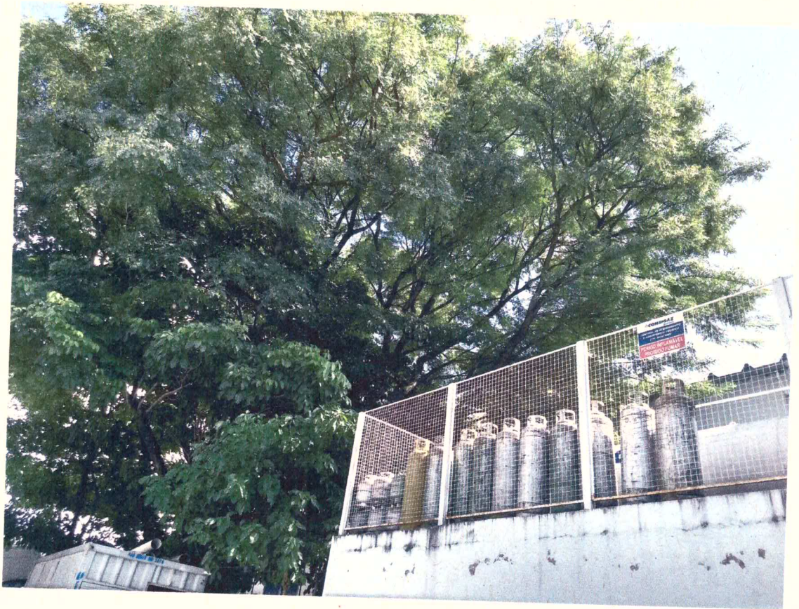
Central de GLP do hospital