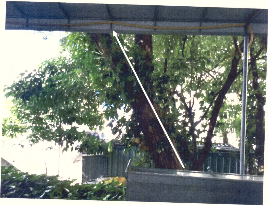
Inclinação da árvore