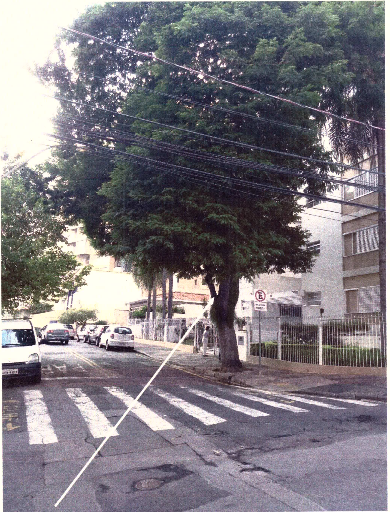
Sibipiruna no número 14