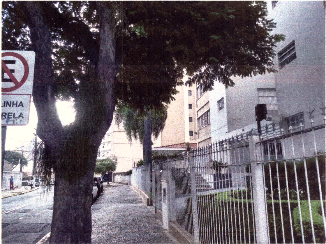
Levantamento de copa