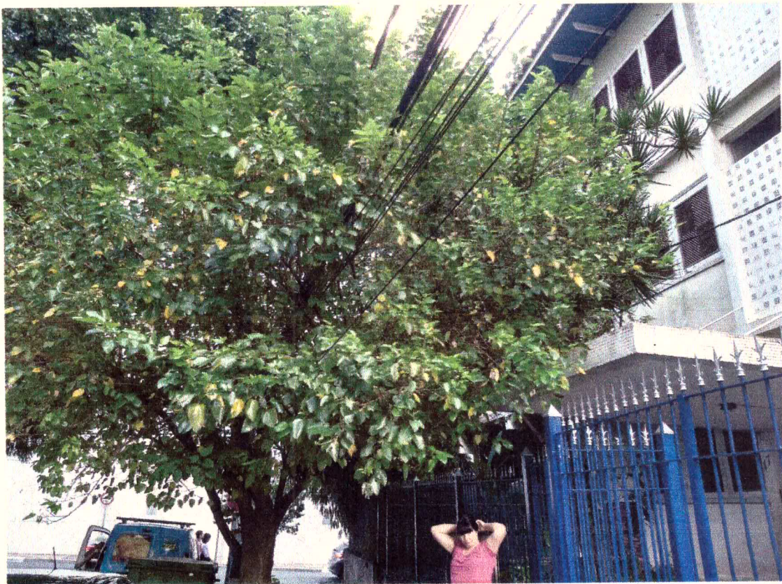
Levantamento de copa da amoreira e do resedá-gigante