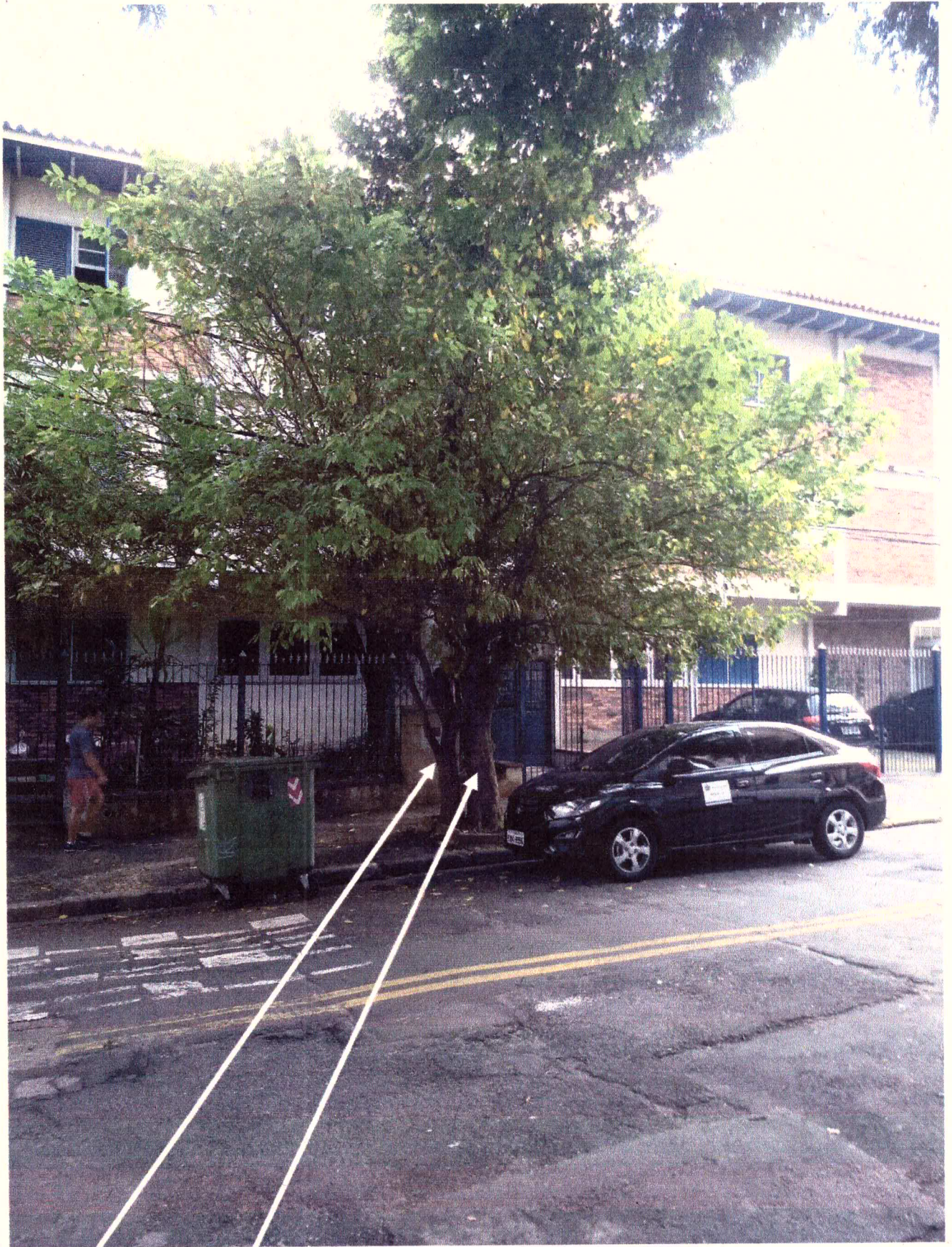
Amoreira e resedá-gigante