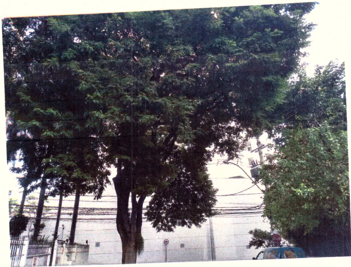
Levantamento de copa