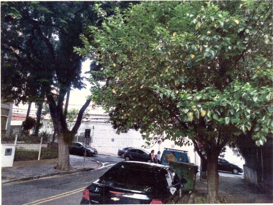
Levantamento de copa