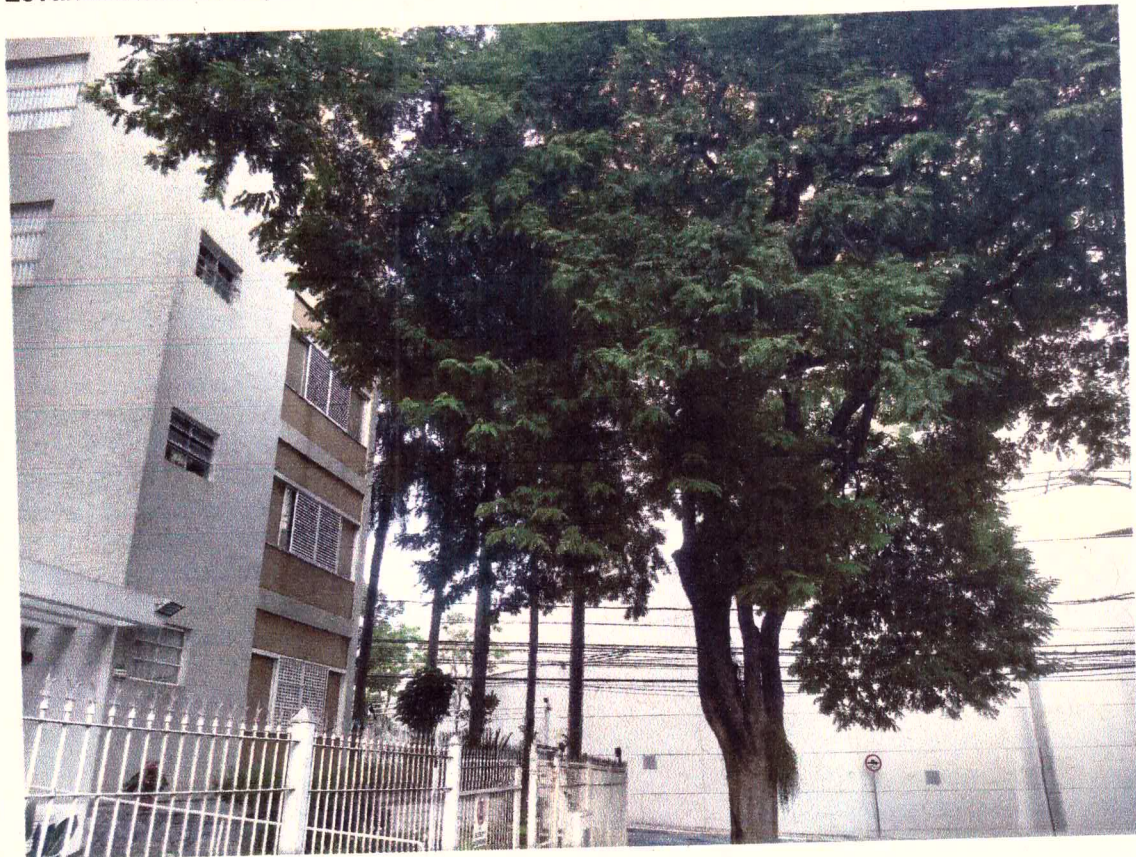
Retirar os ramos que estão muito perto da edificio