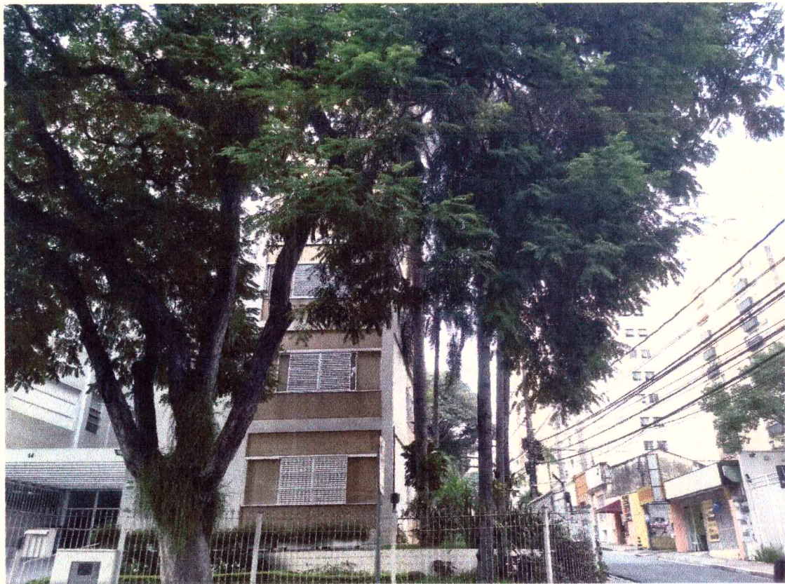
Levantamento de copa